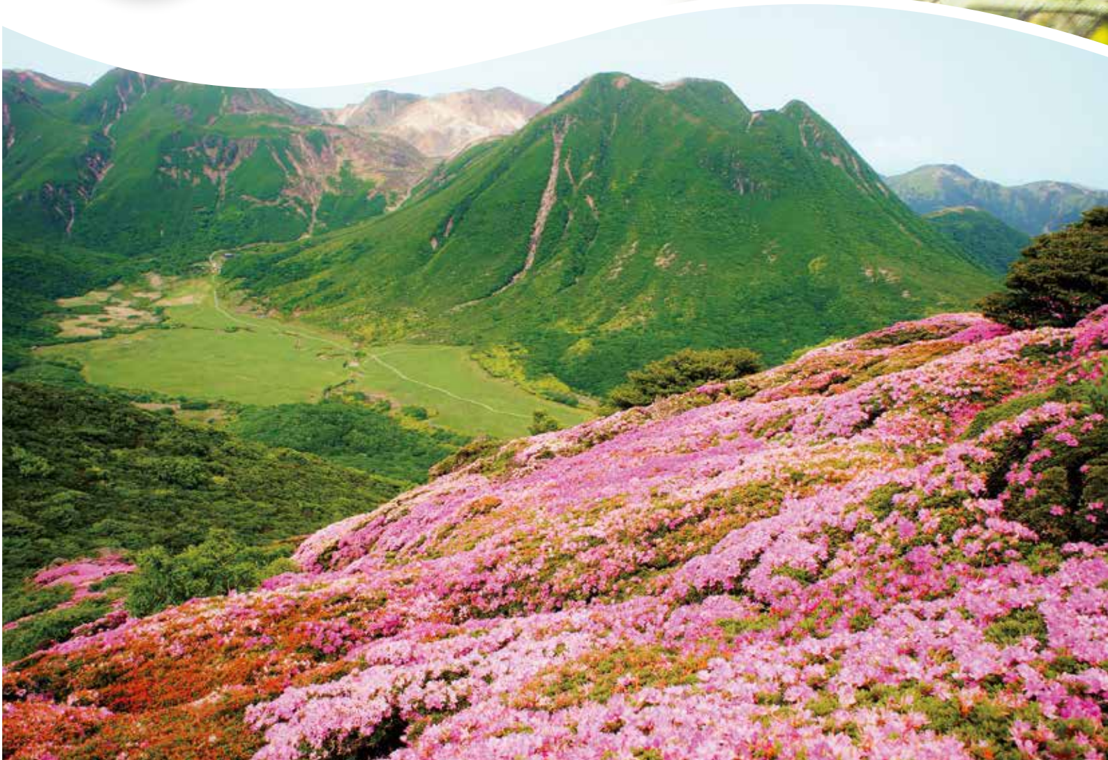
撮影者/主任理学療法士 溝部 勝幸