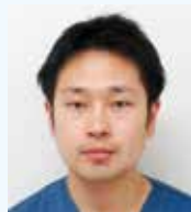
循環器内科 ササキ モトキ 佐々木 基起 (非常勤) 金曜午前